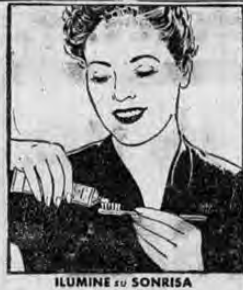
ILUMINE su SONRISA con KOLYOS